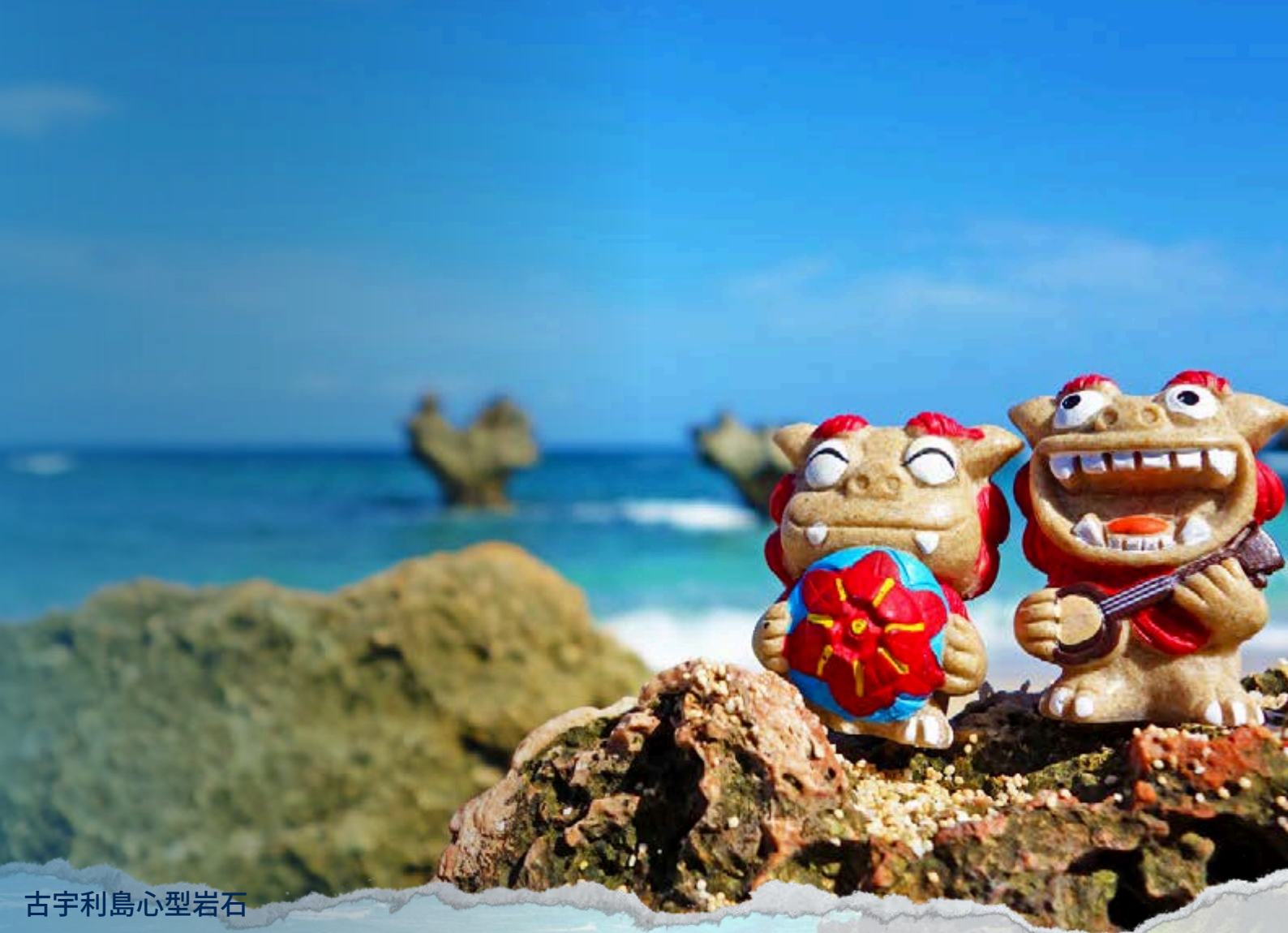
古宇利島心型岩石