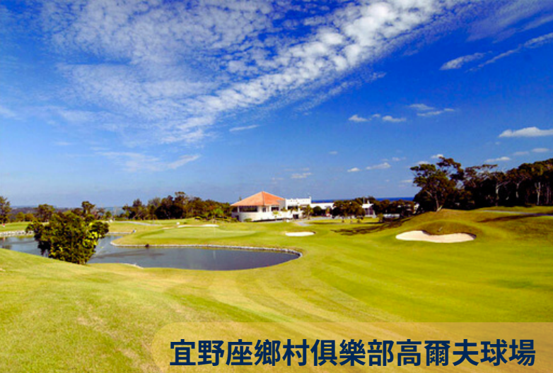
宜野座鄉村俱樂部高爾夫球場