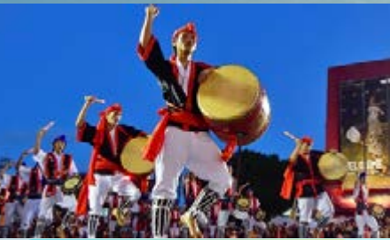
哎薩琉球傳統舞蹈