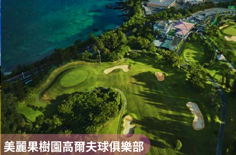
美麗果樹園高爾夫球俱樂部